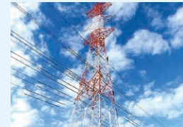
送電鉄塔・送電線工事