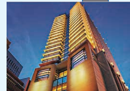
ザ・ペニンシュラ東京